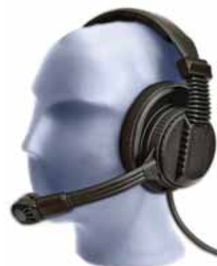
Modell D 800 E