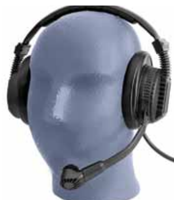
Modell D 900