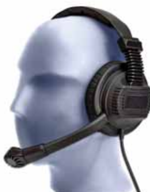
Modell D 900 E

Die robusten Gehäuse sind aus speziellem, schlagfestem PE-Material gefertigt. Bei der Konstruktion wurde besonders auf die akustische und elektrische Isolation zwischen Mikrofon und Kopfhörer geachtet, um das übliche Problem des Übersprechens bei Mehrkanal-Intercom-Systemen zu minimieren. Auch wurde durch Einsatz spezieller Ohrpolster die Außengeräuschdämpfung ohne Verlust an Tragekomfort so optimiert, dass selbst längeres Tragen bei hohem Umfeldgeräusch nicht ermüdet. Das symmetrische Mikrofon mit Nierencharakteristik bietet hohe Rückwärtsdämpfung und einen effektiven Windschutz.