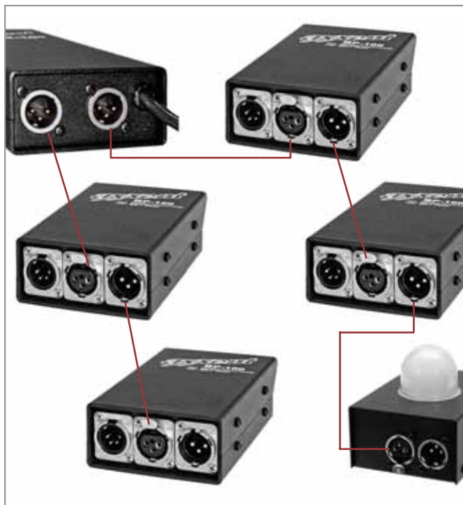
Schematische Darstellung eines typischen Systembetriebes

Da der Einsatz von Digitalmischpulten oft keine Side-Racks mehr notwendig macht, ist diese Stromversorgung eine kompakte Möglichkeit des Betriebs einer Intercomanlage. Bis zu 6 Intercom-Beltpacks können mit einer PS-100 betrieben werden. Die Stromversorgung besitzt zwei Partyline-Intercom-Ausgänge mit XLR-M-Steckverbindungen, eine auswechselbare Sicherung und einen Spannungswahlschalter 120 V/240 ~V.