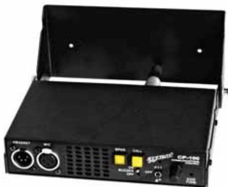
CP-100 mit Wandhalterung