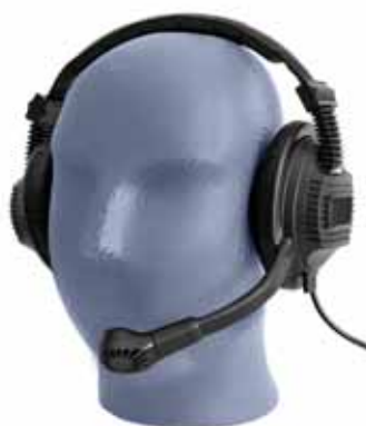
Modell D 800