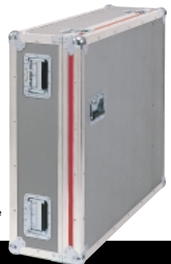
LICON 1X Flightcase

JB-lighting Lichtanlagentechnik GmbH Sallersteigweg 15 · D-89134 Blaustein-Wippingen Telefon +49 (0) 7304/9617-0 · Telefax +49 (0) 7304/9617-99 www.jb-lighting.de