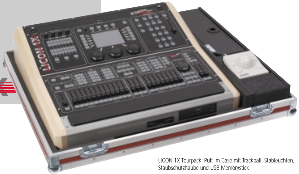
LICON 1X Tourpack: Pult im Case mit Trackball, Stablichtern, Staubschutzhaube und USB Memorystick